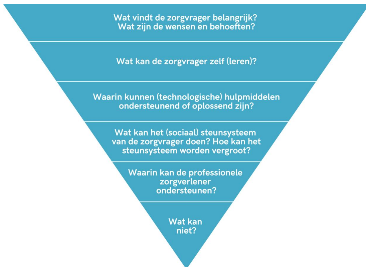
Figuur 2 Stappen in de verkenning van zelfredzaamheid van zorgvrager en steunsysteem (Reijngoudt & van Dorst, 2024)

piramide dient van boven naar beneden gelezen te worden en dient bij iedere evaluatie opnieuw doorlopen te worden.