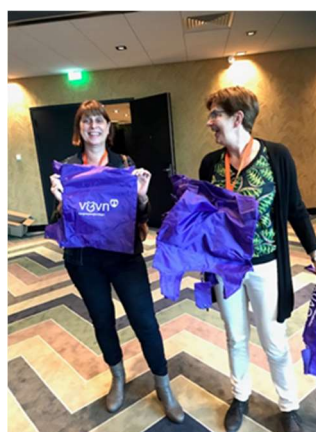
Cadeautje van de voorzitter