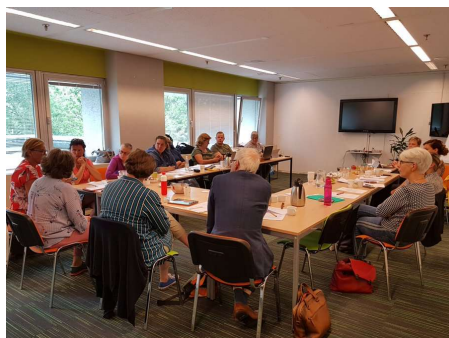
Beleidsdag juni 2019 met taakgroepen en commissies