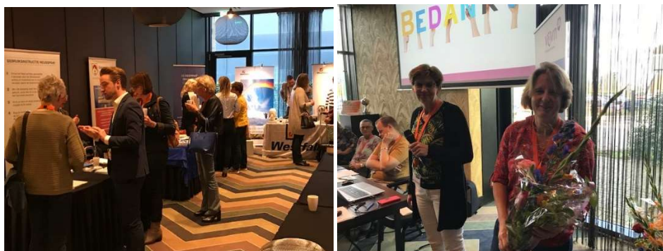
Impressie Ledendag 2019