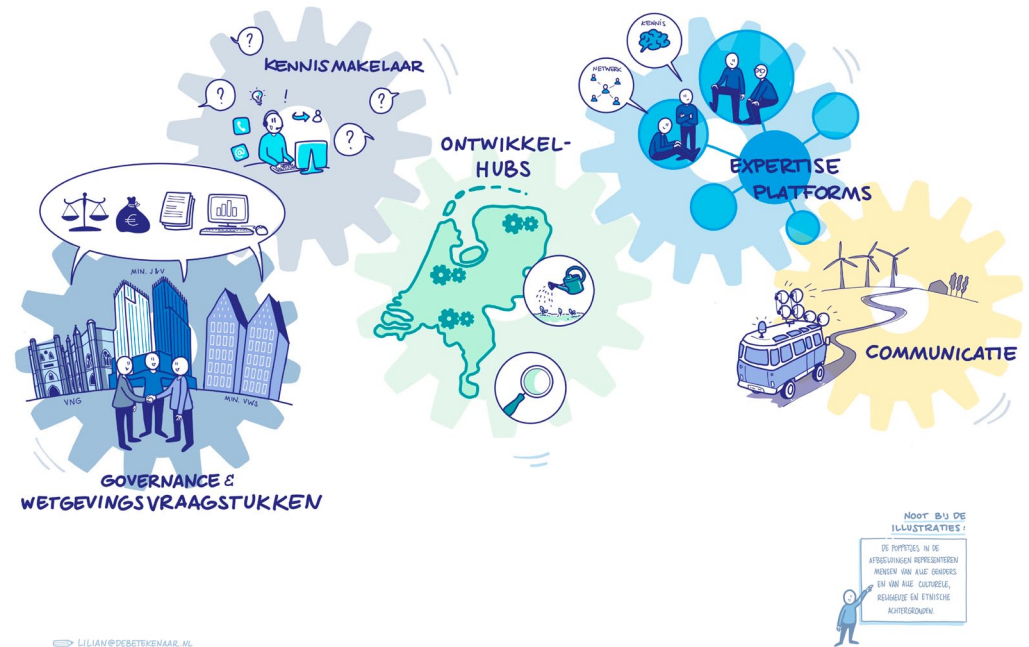
Afbeelding 3 - Vervolgaanpak